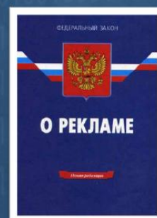
Федеральный закон Российской Федерации № 38-ФЗ «О рекламе»