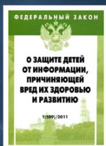
Федеральный закон Российской Федерации № 436-ФЗ «О защите детей от информации, причиняющей вред их здоровью и развитию»